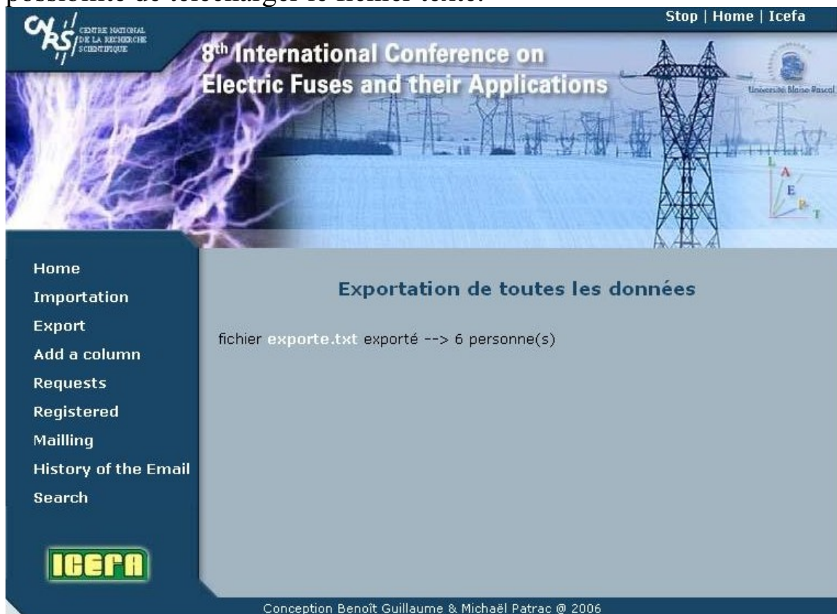
Figure 4: L'exportation des données

Dès que l'utilisateur a cliqué sur l'onglet « export », le fichier a déjà été créé. Il est disponible dans le répertoire « tmp » par défaut. Cela dit, il suffit de cliquer sur le lien « exporte.txt » pour avoir la possibilité de télécharger le fichier texte.