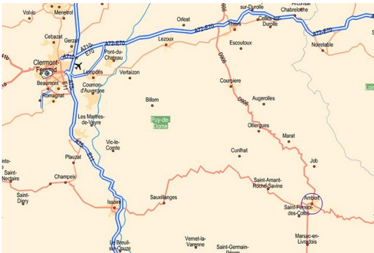
Figure 2: Carte localisant Elforia Design (à Ambert)

Société jeune et dynamique, nous souhaitons à Elforia Design de perdurer, puisque son travail est de bonne qualité (nous l'avons d'ailleurs réutilisé pour notre projet).