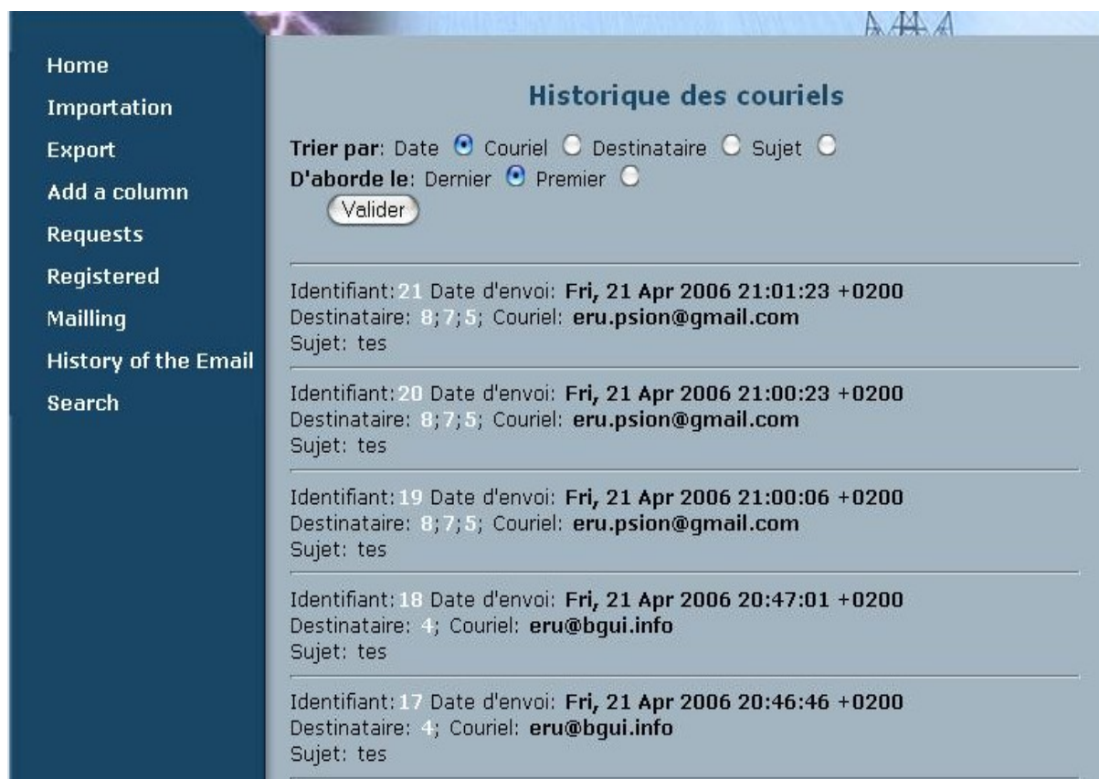
Figure 12: L'historique des courriels

Quant aux courriels de masse, il sont traités comme un courriel unique dans cet historique : il y aura juste plusieurs identifiants pour les destinataires.