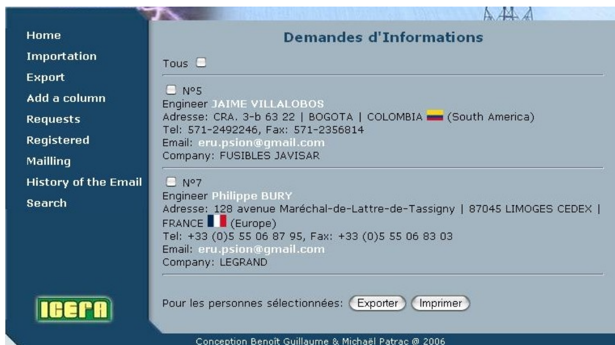
Figure 7: L'écran de visualisation des personnes

L'écran montre toutes les personnes incluses sans distinction : on peut alors toutes les sélectionner ou les choisir pour soit les exporter soit les imprimer.